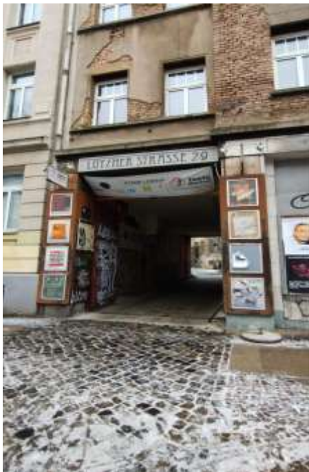
Einfahrt zum NSL