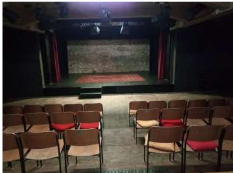
Blick auf die Bühne