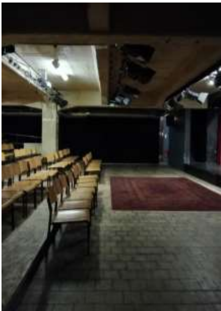
Blick in den Saal