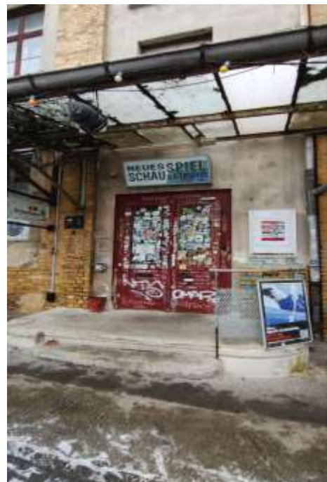
Eingangstür des NSL